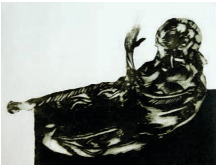
Gentian Gashi Grafikë, akuatint Kosovë