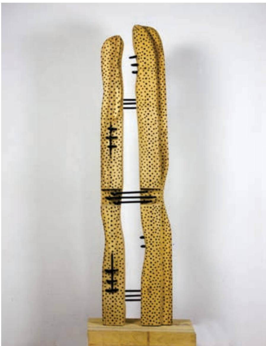
Naim Iseni / Skulpturë, tekn. e kombinuar / Maqedoni ÇMIMI PËR SKULPTURË