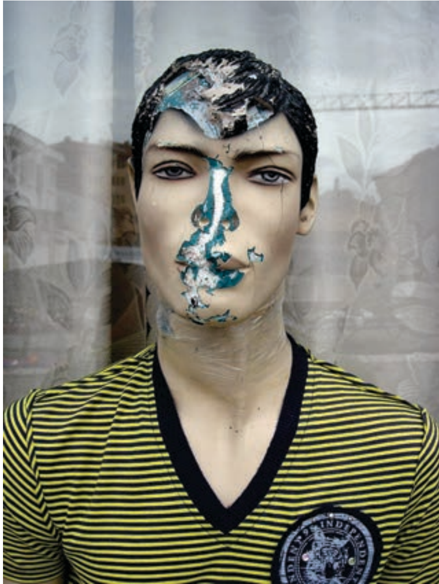
Burim Myftiu / Fotografi, fotografi digjitale / Kosovë ÇMIMI PËR FOTOGRAFI