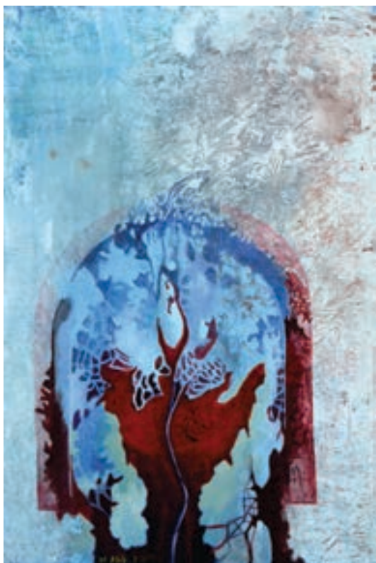
Muhamedali Alili - DALI Pikturë, vaj në pëlhurë Maqedoni