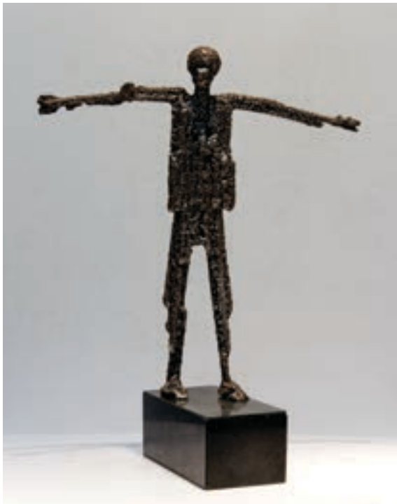
Xhelil Rufati Skulpturë, hekur Maqedoni