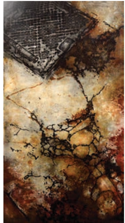
Shkurta Haxhiu Grafikë, akvatint Kosovë