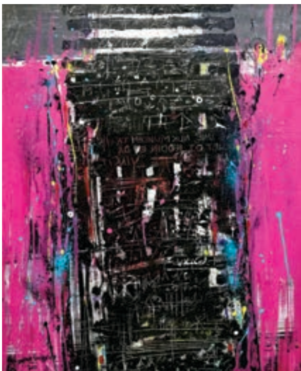
Burim Ukiçi Pikturë, vaj në pëlhurë Maqedoni