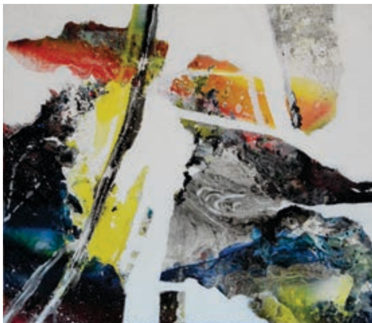
Fehmi Hoxha - FEHO Pikturë, tek. e kombinuar Kosovë