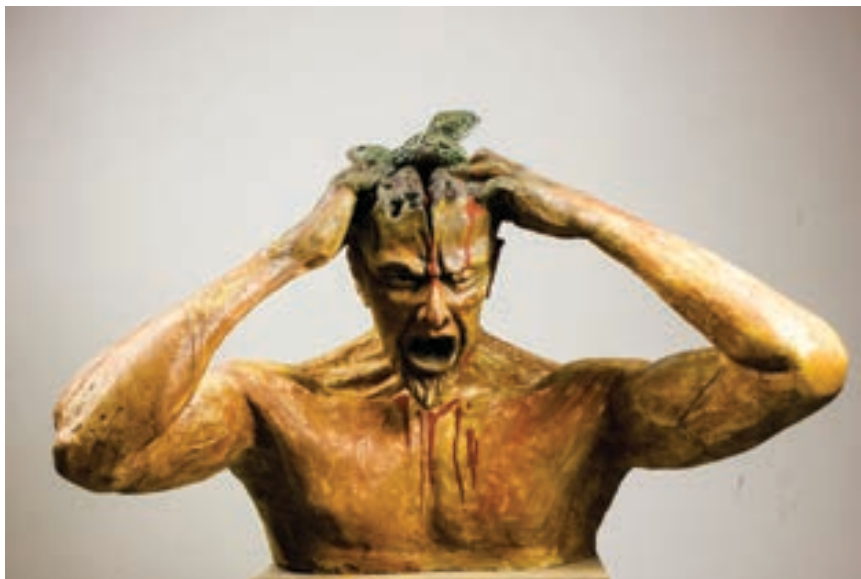
Ardian Kadriu Skulpturë, Allçi Maqedoni