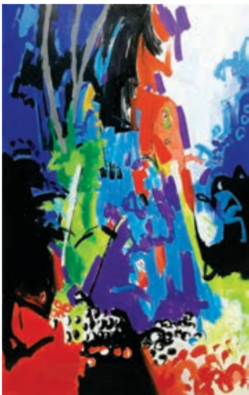
Genc Bekteshi Pikturë, akrilik në pëlhur Kosovë