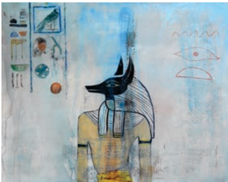
Zara Popaj Pikturë, vaj në pëlhurë Kosovë