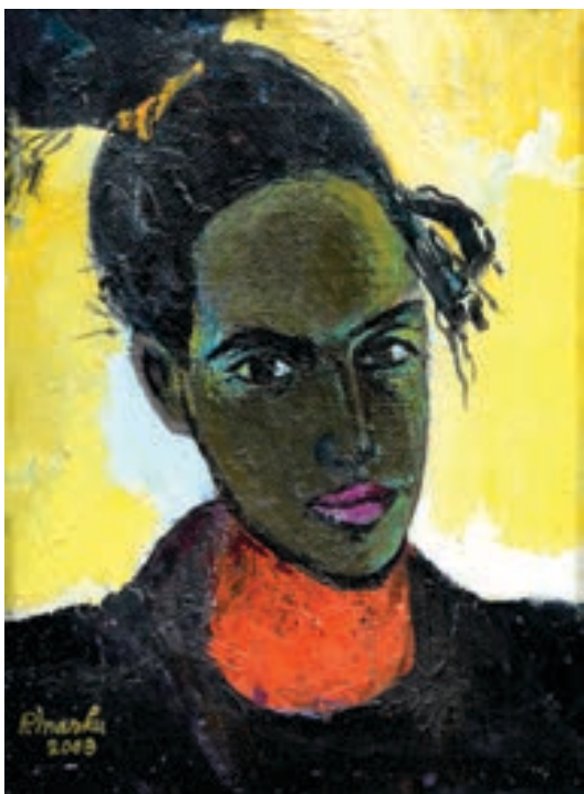
Pjetër Marku Pikturë, vaj në pëlhurë Shqipëri