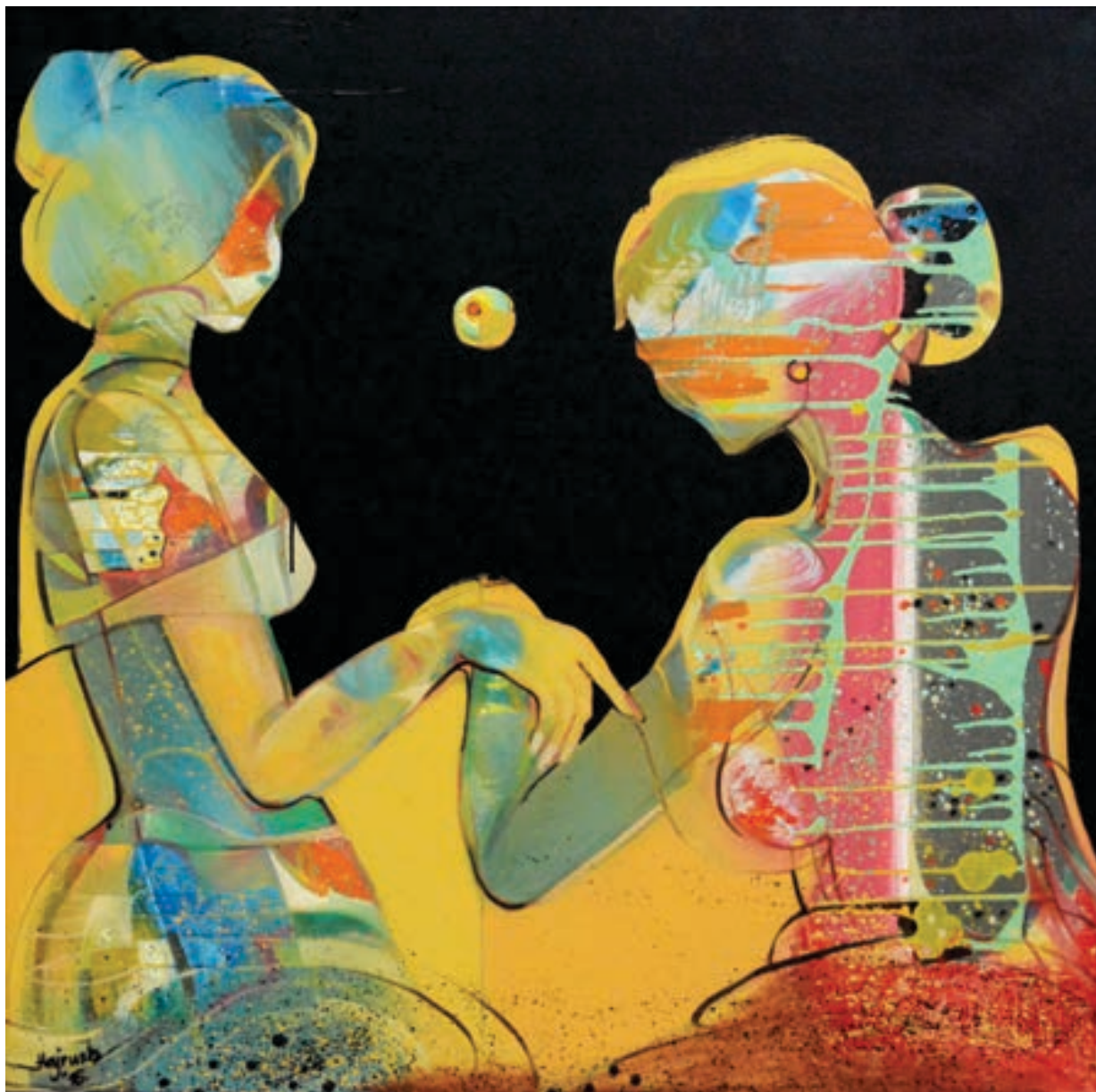
Hajrush Fazliu / Pikturë, vaj në pëlthurë / Kosovë ÇMIMI I NËNTORIT 2017