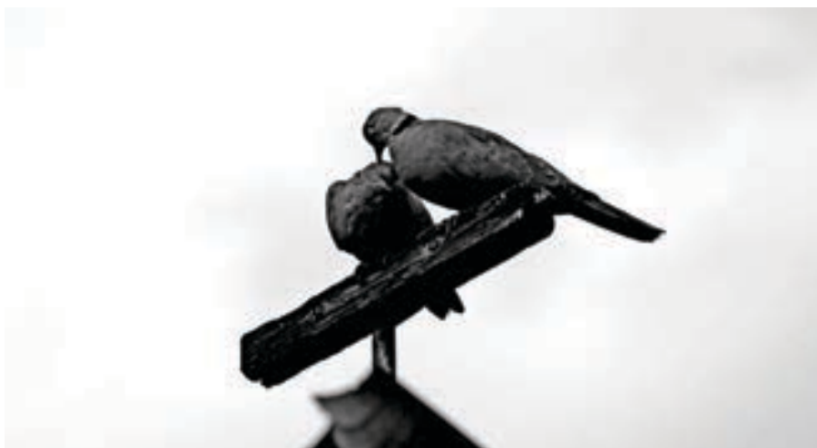
Rozafa Shpuza Fotografi, fotografi digjitale Shqipëri