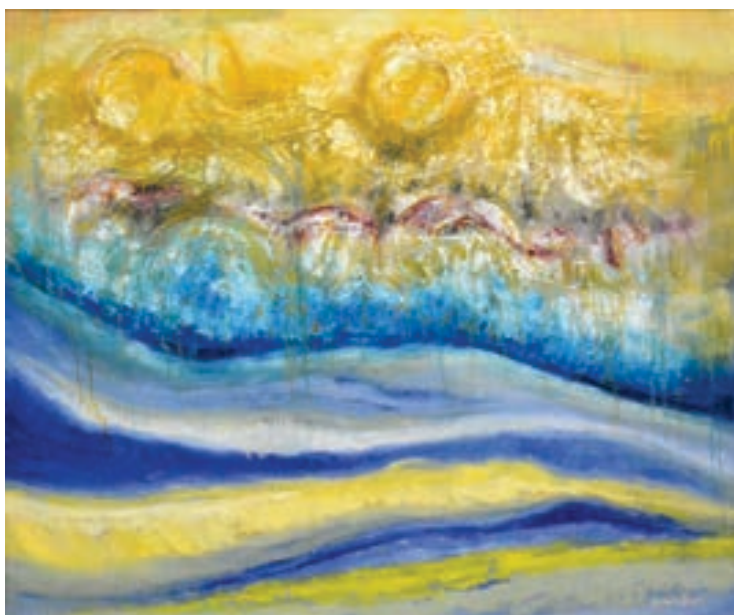
Armend Ademi Pikturë, vaj në pëlhurë Maqedoni