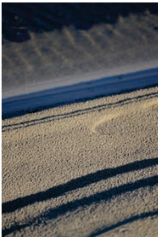
Osman Demiri Fotografi, fotografi digjitale Maqedoni