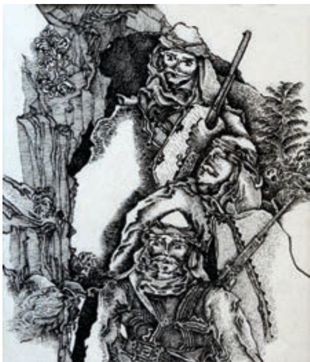
Demush Avdimetaj Vizatim Kosovë