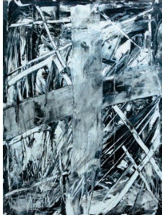
Skender Idrizi Pikturë, akrilik në pëlhurë Kosovë