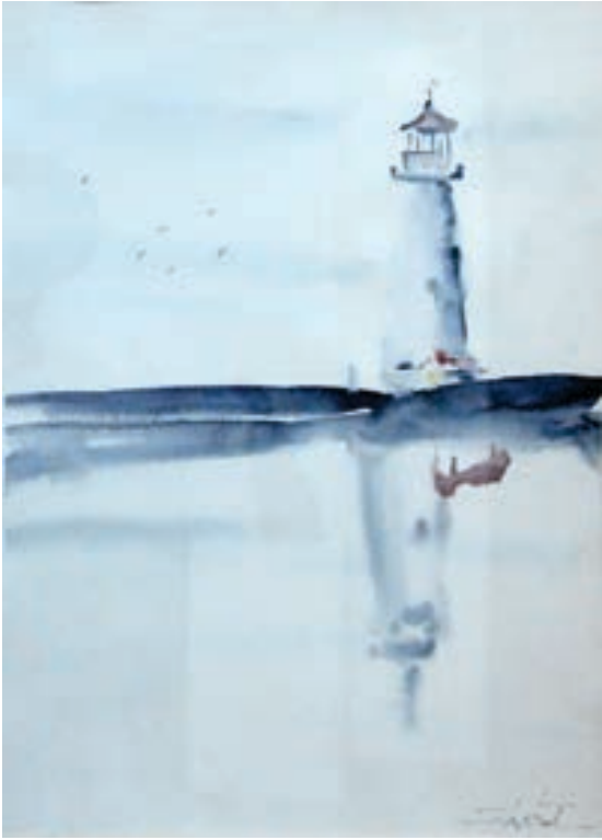
Shpend Zeqiraj Akuarel Kosovë