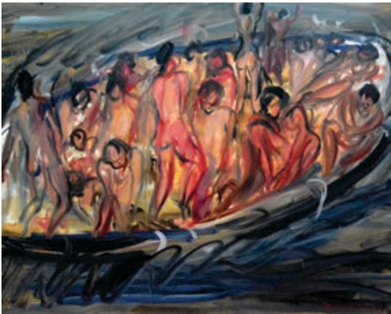
Hasan Nalbani Pikturë, vaj në pëlhurë Shqipëri