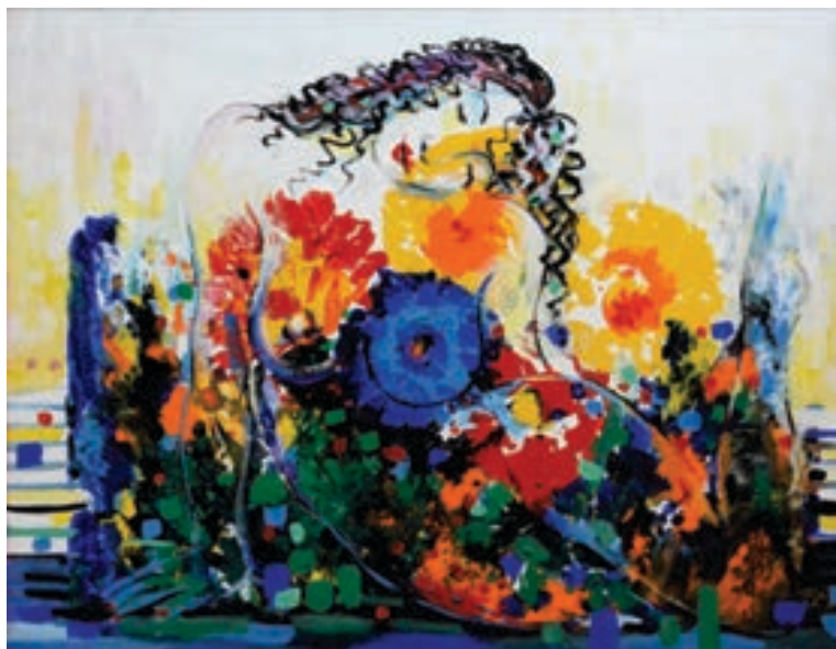
Refki Golopeni - REGO Pikturë, vaj në pëlhurë Kosovë