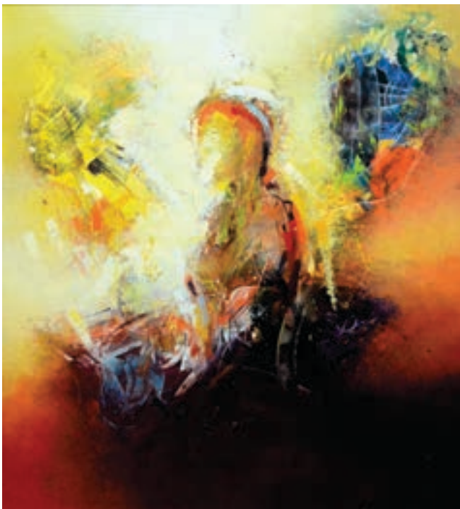
Reshat Ameti Pikturë, vaj në pëlhurë Maqedoni