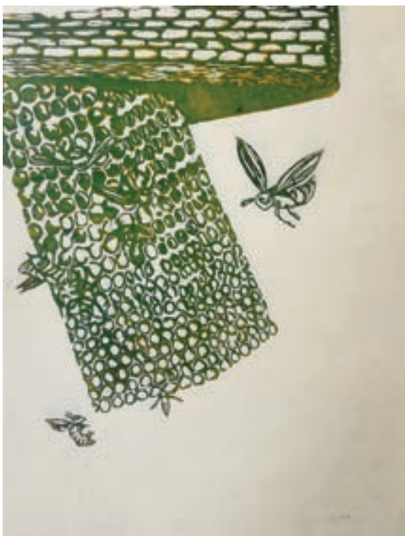
Ruzmira Beqiraj - Bejaj Grafikë, linogravur Shqipëri