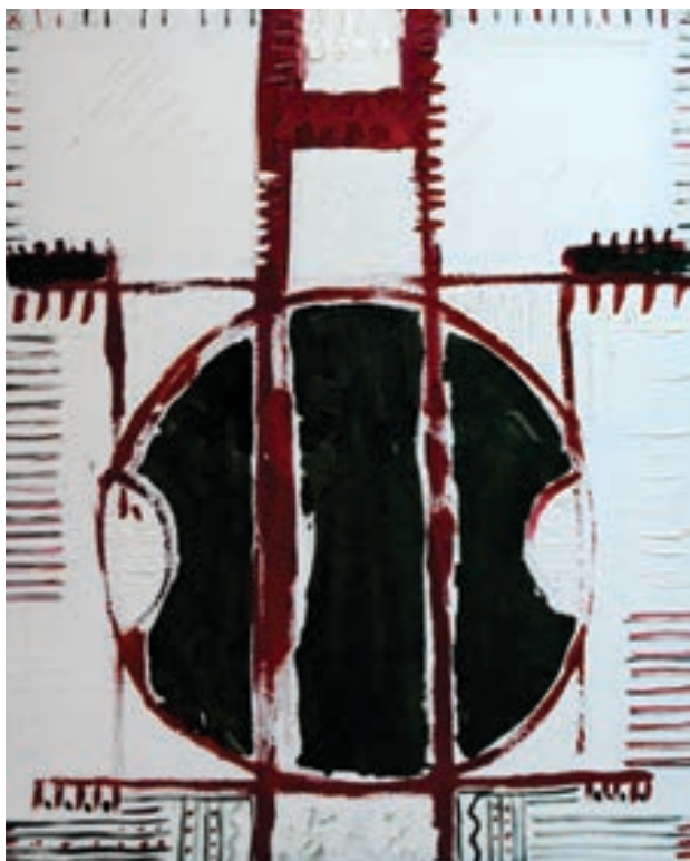
Shaqir Veseli Pikturë, vaj në pëlhurë Shqipëri