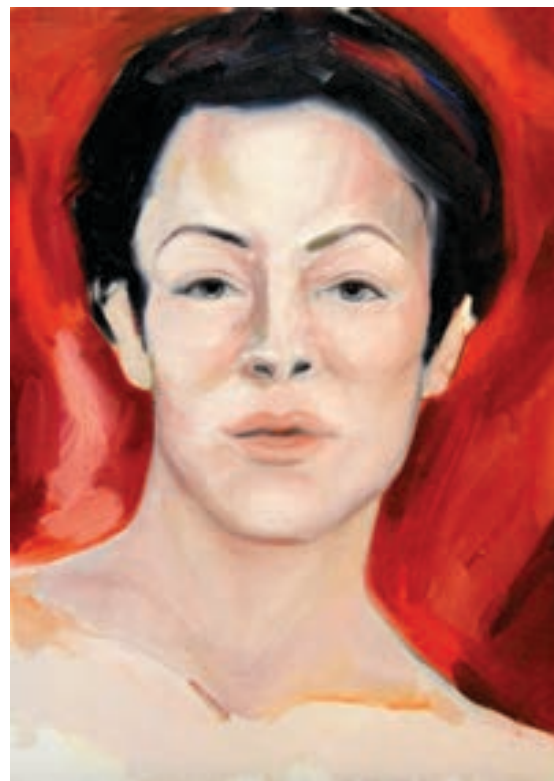
Aneta Hasani Pikturë, vaj në pëlhurë Kosovë