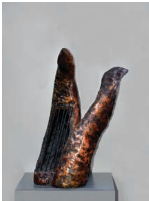
Muamer Sadiku Skulpturë, tekn. e kombinuar Maqedoni