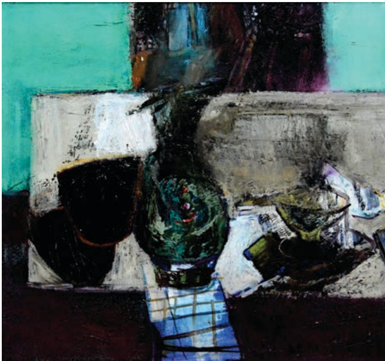
Zenun Sherifi / Pikturë, vaj në pëlhurë / Maqedoni ÇMIMI PËR PIKTURË