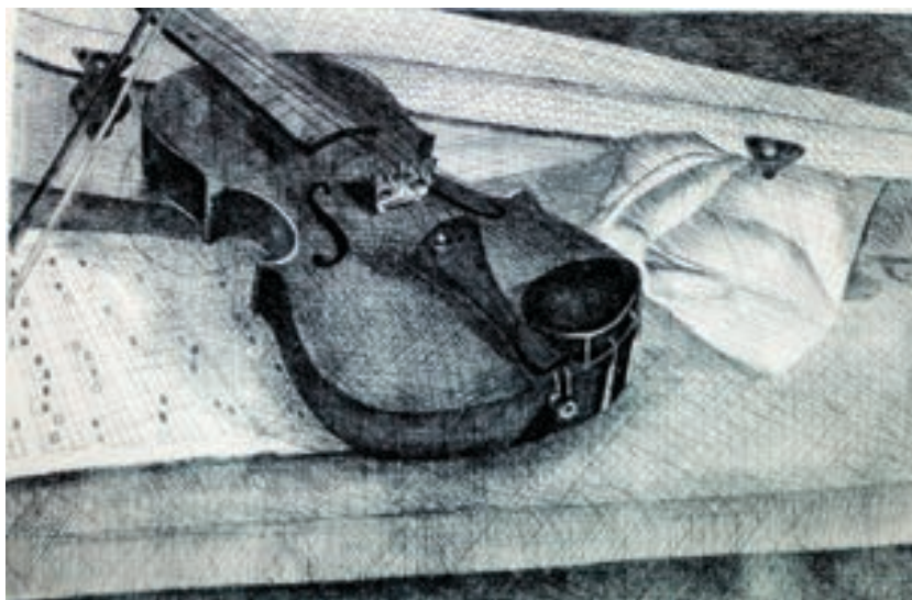
Naim Idrizi Grafikë, bakërshkrim Maqedoni