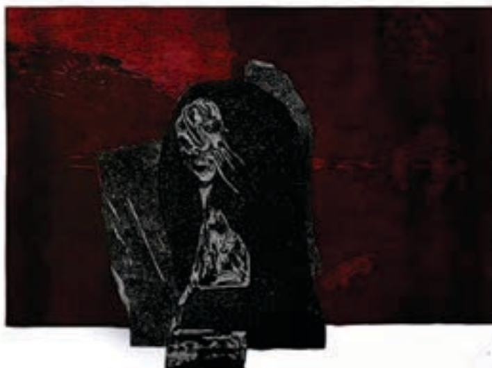
Hanife Islami Grafikë, akuatint Maqedoni