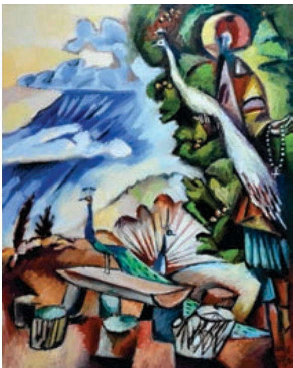
Atanas Kostadini Pikturë, vaj në pëlhurë Shqipëri