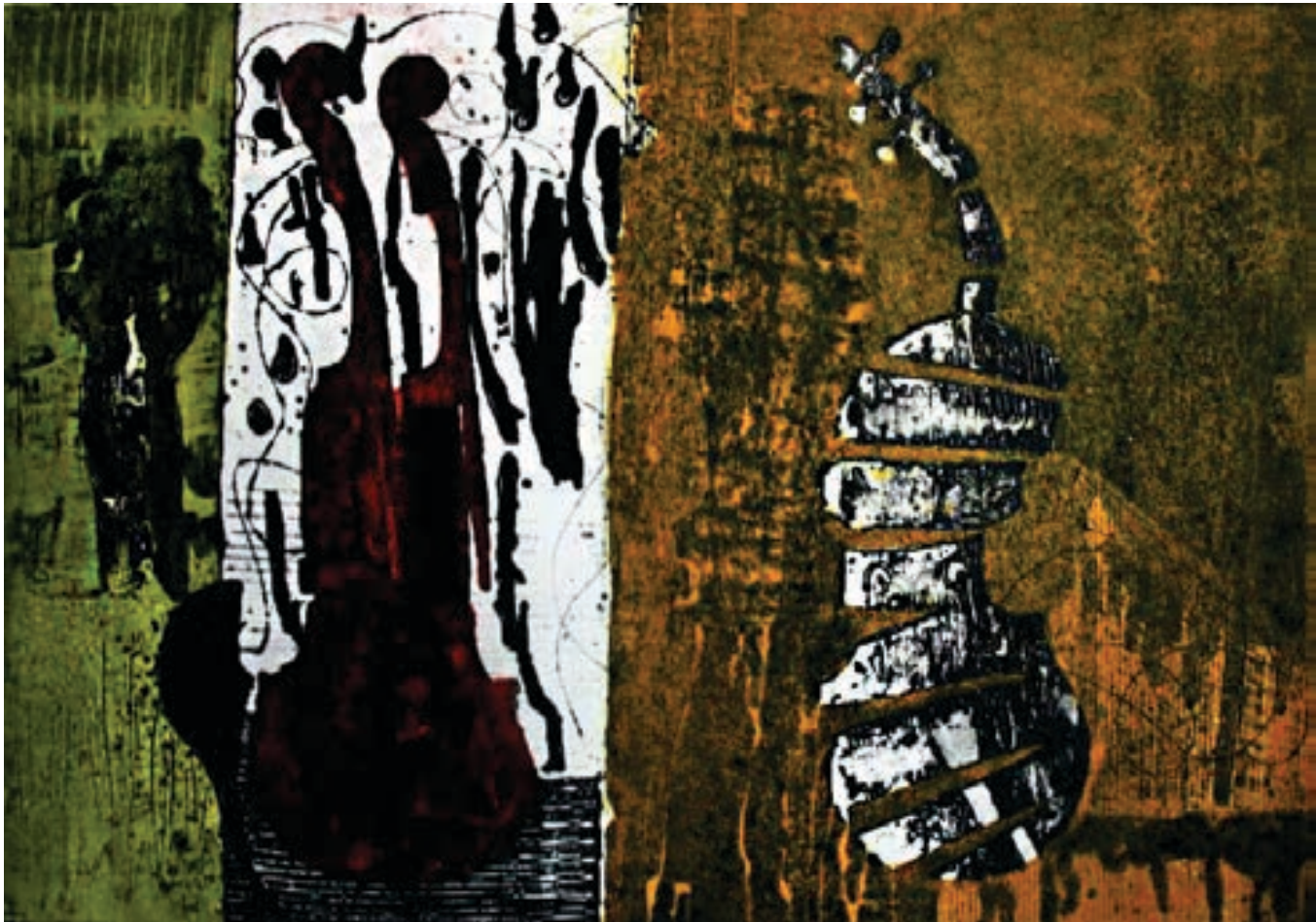
Ridvan Aliti / Grafikë, vaj në pëlhurë / Maqedoni ÇMIMI PËR GRAFIKË