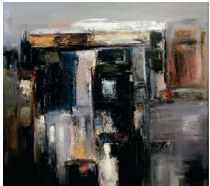
Melik Arslani Pikturë, vaj në pëlhurë Maqedoni