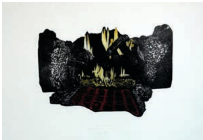
Denis Gashi Grafikë, akvatint Kosovë