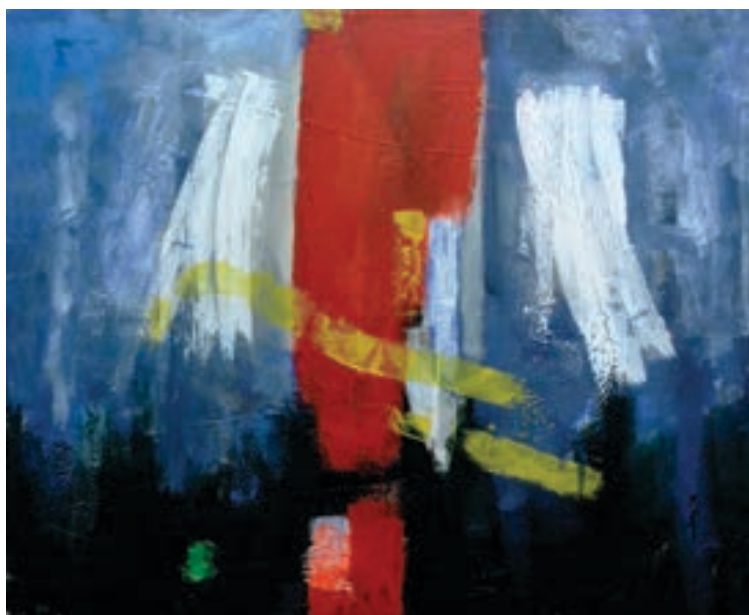
Luan Zenki Pikturë, vaj në pëlhurë Maqedoni