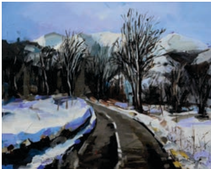
Dashmir Bajrami Pikturë, vaj në pëlhurë Maqedoni