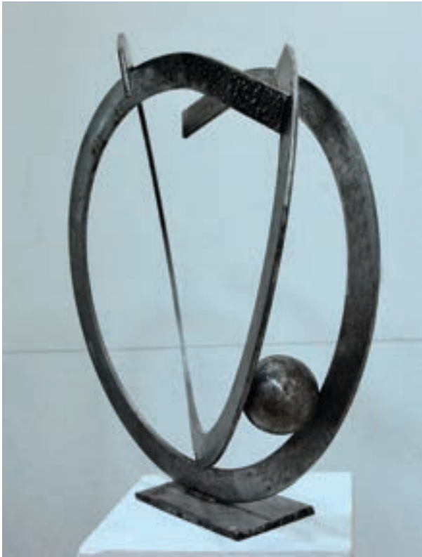
Arlind Bajrami Skulpturë, hekur Maqedoni