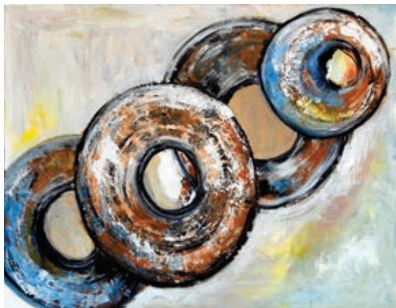
Ismane Mehdi Pikturë, akrilik në pëlhurë Maqedoni