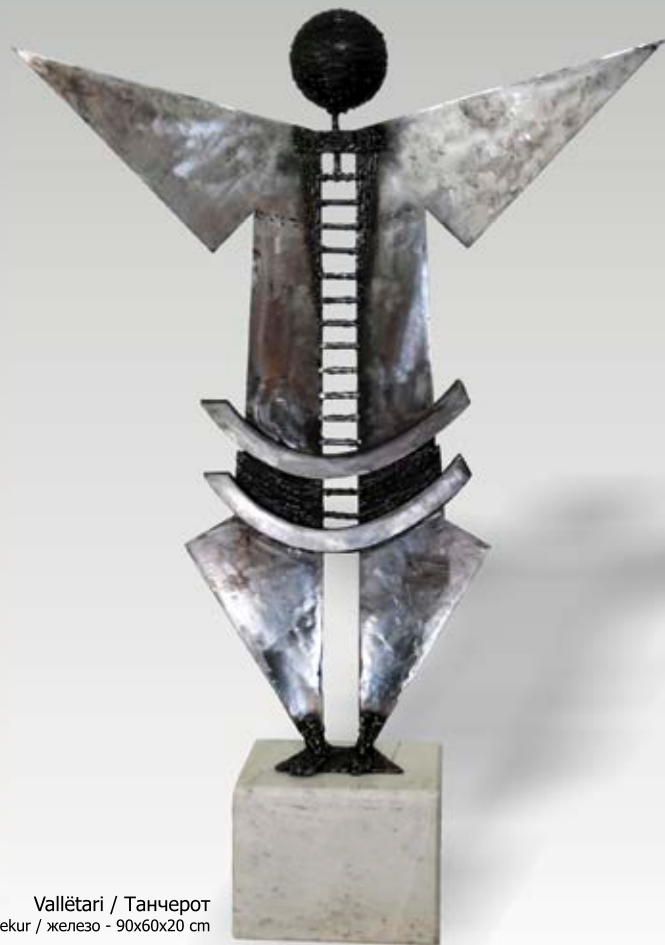
Vallëtar / Танчерот hekur / железо - 90x60x20 cm