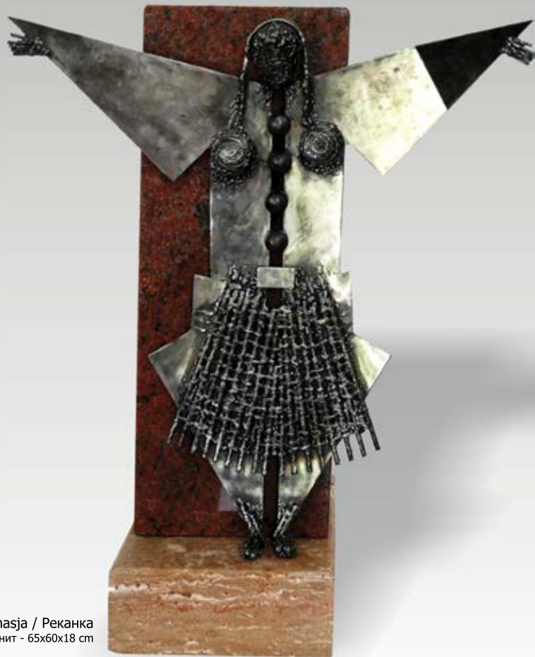
Rekanasja / Реканка hekur dhe granit / железо и гранит - 65x60x18 cm