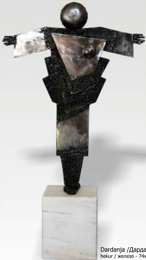
Dardanja / Дарданка hekur / железо - 74x50x20 cm