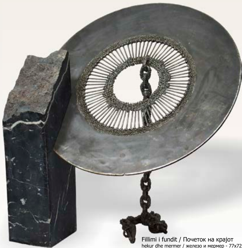
Fillimi i fundit / Почеток на крајот hekur dhe mermer / железо и мермер - 77x72x67 cm