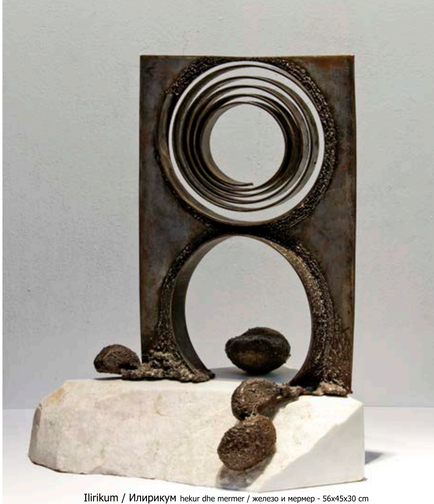
Ilirikum / Илирикум hekur dhe mermer / железо и мермер - 56x45x30 cm