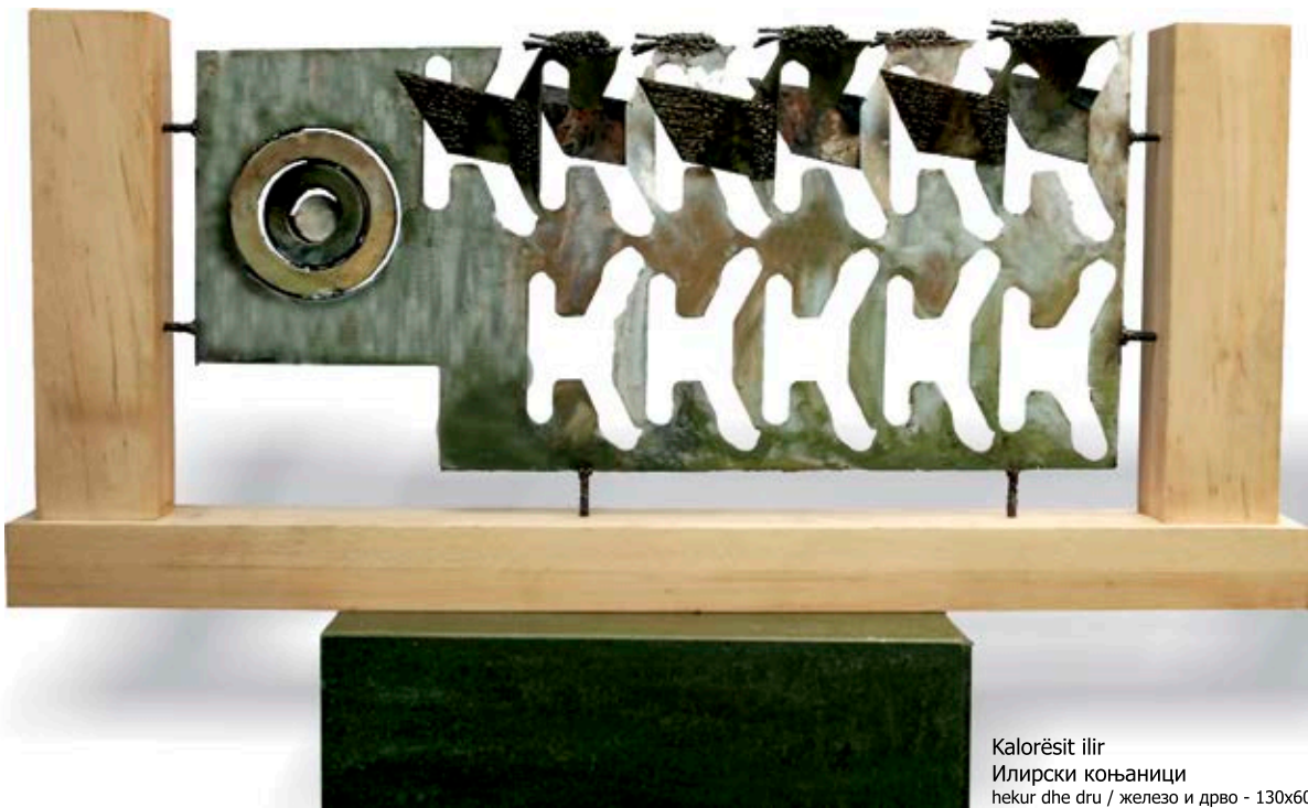
Kalorësit ilir Илирски коњаници hekur dhe dru / железо и дрво - 130x60x20 cm