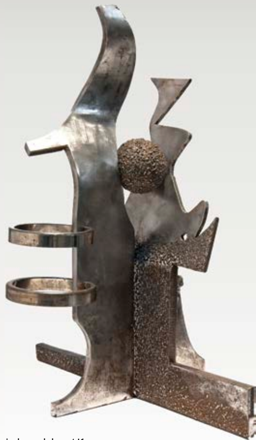
Gjithësia komplekse / Комплексен универзум hekur / железо -65x56x40 cm