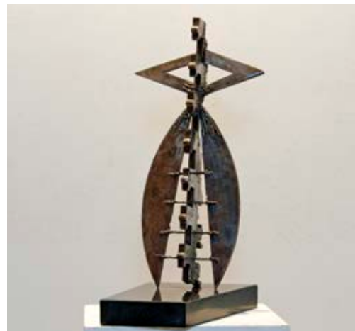
Tradita / Традиција hekur dhe granit / железо и гранит - 65x40x25 cm