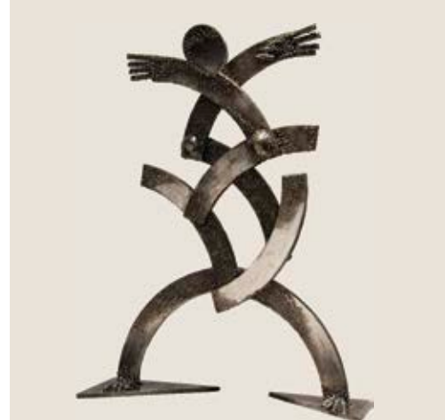
Forma dikur / Облиците некогаш hekur / железо - 76x59x46