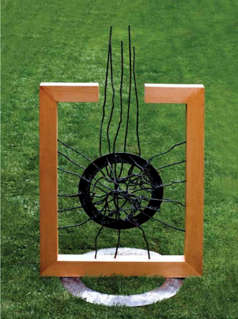
Dielli i kornizuar / Временото сонце hekur dhe dru / железо и дрво - 158x105x22