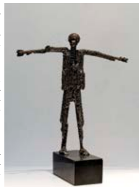
Figura ulur Седната фигура hekur dhe mermer железо и мермер 39x25x27 cm