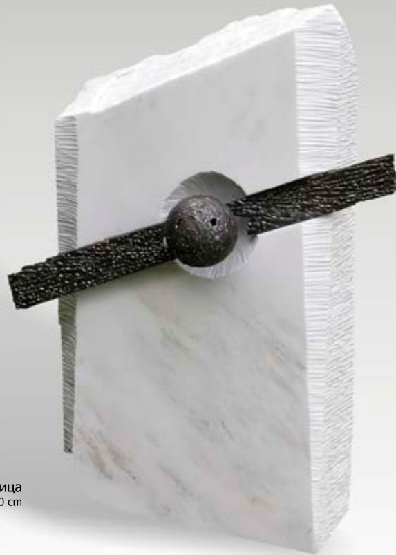
Bebëza e diellit / Солнчева зеница mermer dhe hekur / мәрмер и жєлєзо - 62x50x20 cm