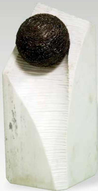
Idhulli / Идол mermer dhe hekur / мермер и железо - 40x18x18 cm