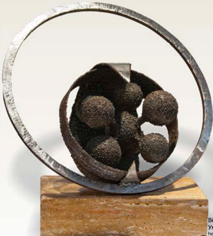
Bërthama e shumëzuar Умножено јадро hekur /железо - 56x35x55